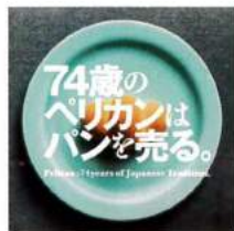
「74歳のペリカンはパンを売る。」 2017年(80分)

日本では仏教の影響で肉食禁止令が発令されたが、肉の代用品となるうまみを求め、大自然の中から昆布という食材を発見した。 一方、和食の基本、醤油・酒・みりん等は、麹カビにより生み出された。長く培われてきた発酵の知恵を描く。