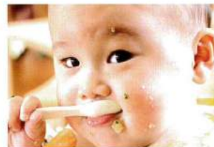
「いただきます みそをつくる子どもたち」 2016年(85分)

「食育」という概念の無かった時代から、独自の試行錯誤を重ねた給食を作ってきた高取保育園。みそ作りや梅干し作り、玄米やみそ汁中心の和食で育つこどもたちの様子を通じ、「食がいのちをすること」を学んでいく様子が撮影されている。