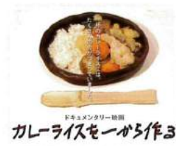
「カレーライスを一から作る」 2016年(96分)

ペリカンは食パンとロールパンの2種類しか作らない浅草の老舗パン屋。 創業から74年間。地元の江戸っ子のみならず、パン好きに愛され続ける秘密を、ペリカンで働く人々の姿やペリカン愛好者のインタビューを通して探っていく。