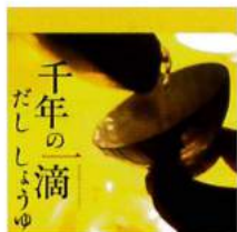
「千年の一滴 だししょうゆ」 2014年(100分)

日本では仏教の影響で肉食禁止令が発令されたが、肉の代用品となるうまみを求め、大自然の中から昆布という食材を発見した。 一方、和食の基本、醤油・酒・みりん等は、麹カビにより生み出された。長く培われてきた発酵の知恵を描く。